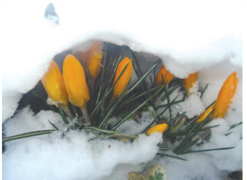
Újra lebeg, majd letelepszik a földre, s bundába takarja a kandi safrányokat