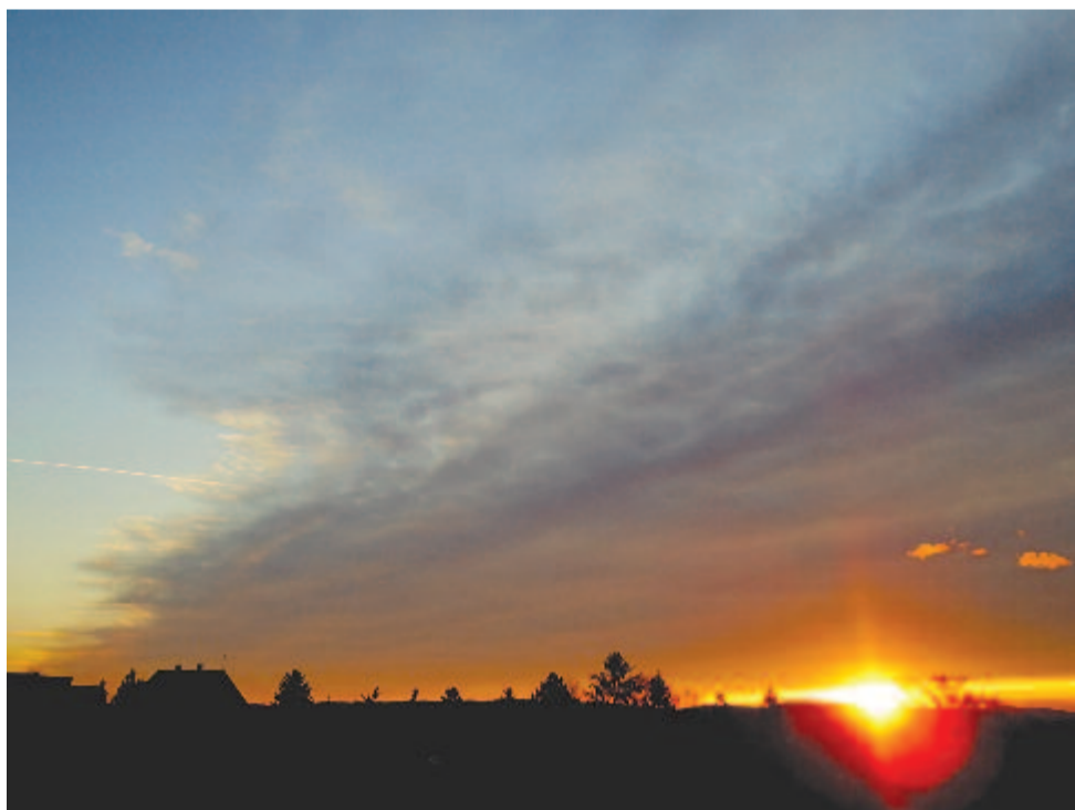
Megvillan a nap. Megvillan az ég. Megvillan a nap, hunyorint

Kelt 2018-ben, három nappal február idusa után